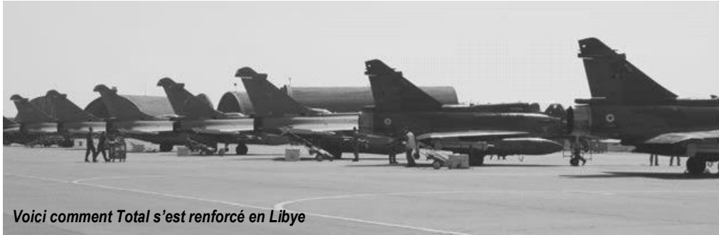
Voici comment Total s'est renforcé en Libye

Les soulèvements dans les pays arabes ont fait très peur aux multinationales françaises et américaines. C'est pourquoi de nouvelles dictatures menacent de se mettre en place.