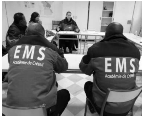
Partout ailleurs, en France et en Martinique, les EMS ont un uniforme...