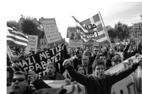
Manif en Grèce, le 28 octobre 2011.

La réponse du gouvernement c'est la répression à coups de matraques, flash-ball, arrestations et emprisonnements. Comme ça ne suffit pas, on leur fait aussi des promesses bidons, comme proposer un référendum