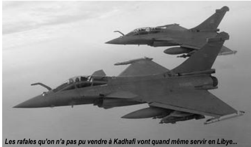
Les rafales qu'on n'a pas pu vendre à Kadhafi vont quand même servir en Libye...

C'est pourquoi, lorsque les anti-Kadhafi libyens ont demandé de l'aide, les grandes puissances ont répondu : « à condition que vous mainteniez tous ces contrats, et que vous continuiez, comme Kadhafi, à parquer dans le désert les Nègres d'Afrique qui essayent de passer en Europe ». Et ils ont attendu que les rebelles se fassent massacrer pour les obliger à accepter.