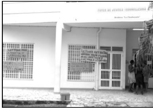
Le foyer Evolia en lutte à Lacroix

Et cet organisme dépend des maires et des collectivités (Région et Département) : les mêmes qui viennent pendant quinze jours de nous expliquer « sa yo té ka-y fè ban-nou » pour les cantonales !