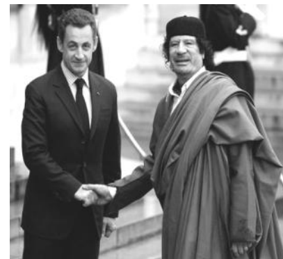
Sarko et son ami Kadhafi en 2007

En Libye, la France, les USA et l'Angleterre viennent s'assurer que le nouveau pouvoir après Kadhafi sera encore une dictature.